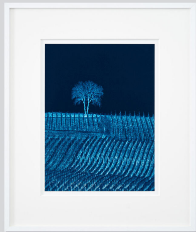
Portrait d'Arbre, Study no. 2, 2018 Cyanotype | 40x30 cm matted 60x50 cm | Edition of 8