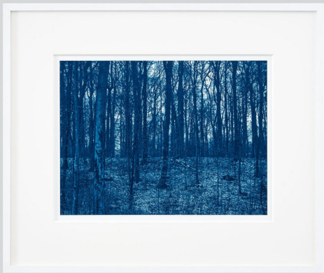
Blue Forest / Black Forest, 2018 Cyanotype | 30x40 cm matted 50x60 cm | Edition of 8

Right: Platinum-palladium | 57x77 cm | Edition of 5