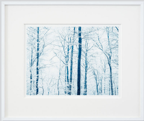
Standing Together, 2018 Cyanotype | 30x40 cm matted 50x60 cm | Edition of 8

Right: Platinum-palladium | 57x77 cm. | Edition of 5