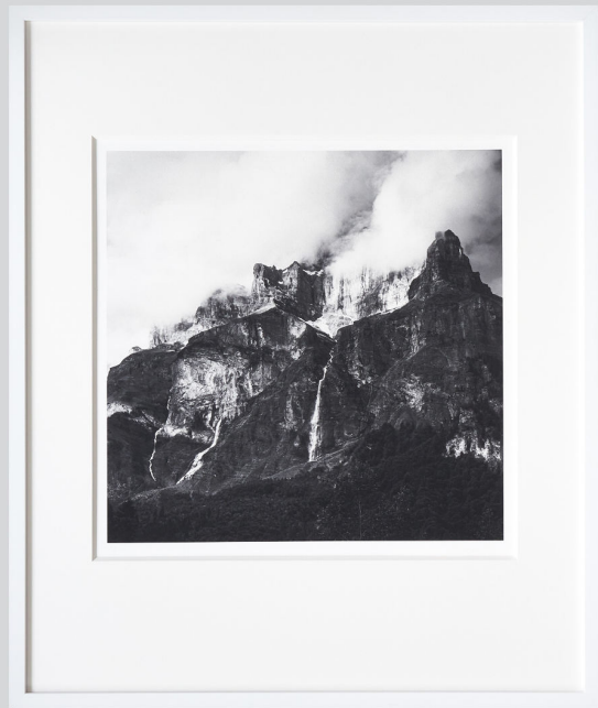
Le Cirque de Sixt, 2018 Platinum-palladium | 35x35 cm matted 60x50 cm | Edition of 8